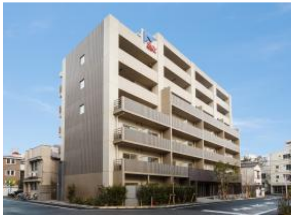
2013年1月撮影(背景など一部CG加工しています)