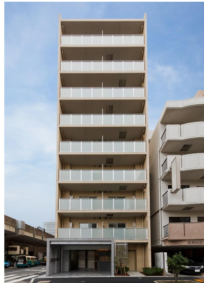
2017年9月撮影(背景など一部CG加工しています)

B2 TYPE 1K 専有面積 / 25.60㎡ バルコニー面積 / 4.62㎡