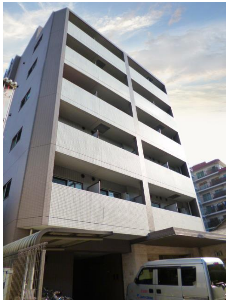
2014年6月撮影(背景など一部CG加工しています)